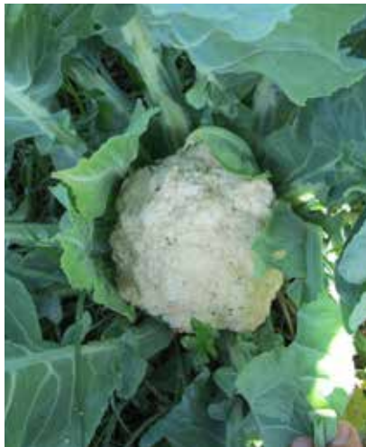
Bròquil o coliflor