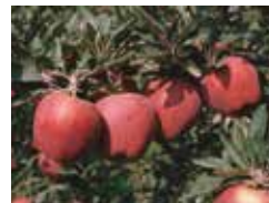
Early red one