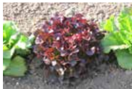
Enciam fulla de roure