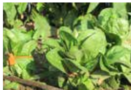
Enciam llarg o romà